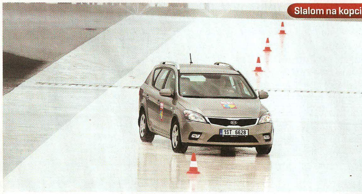
Slalom na kopci

Není třeba být ani rychlý, ani šikovný, ale nestresovat se. Ve čtvrté disciplíně je nutná jen zkušenost z provozu, kterou